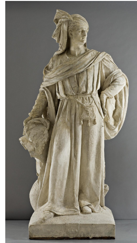
PREAULT Antoine Augustin ( Paris, 1810 - Paris, 1879 )