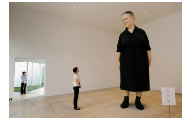
"Standing Woman" by Ron Mueck 2008