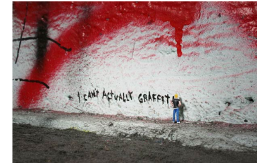
Slinkachu "The Little People Project" 2006